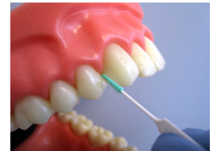
BROSSE INTERDENTAIRE JETABLE

CURE-DENTS DENTAIRES sont habituellement fait de bois comme le bouleau, ce qui aide à réduire la séparation. Sa forme est construite pour lui permettre de s'insérer dans les espaces entre les dents. Les cure-dents sont parfois appelés nettoyeurs interdentaires, bâtonnets en bois interdentaires, Stimudents, pics dentaires, pics dentaires souples ou Go between