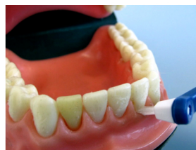
BROSSE INTERDENTAIRE RÉUTILISABLE

BROSSETTES INTERDENTAIRES sont des manches larges et des brochettes cylindriques qui s'introduisent bien entre les dents. Certains modèles ont des manches permanents avec des brochettes remplaçables. Ces brochettes ont besoin de la même attention que des brosses à dents régulières. Certaines brochettes interdentaires sont complètement jetables. Les brochettes interdentaires peuvent être trempées dans le rince-bouche ou additionnées de dentifrice pour aider à nettoyer entre les dents.